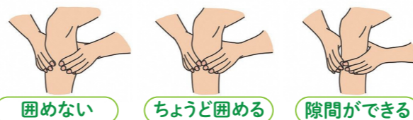
困めない ちょうど困める 隙間ができる