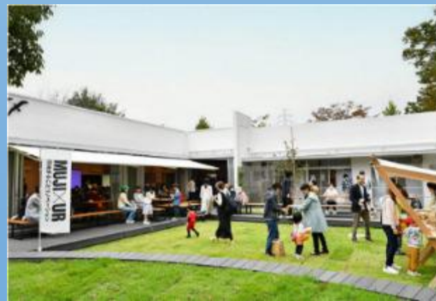
【参考事例(イメージ)】