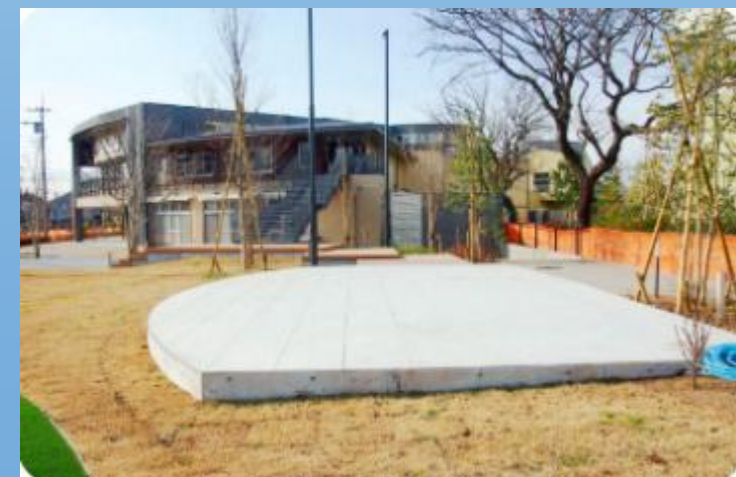
【参考事例(イメージ)】