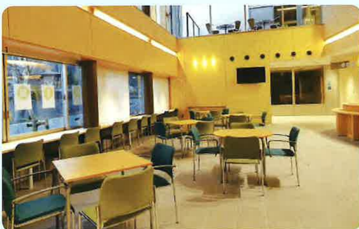
ロビーからテラス側を見た様子