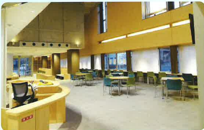
① 受付・ロビー・ラウンジ (1F)