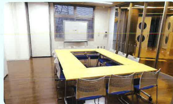
⑧ 会議室2 (2F) ※会議室1と2は一体的に使うこともできます