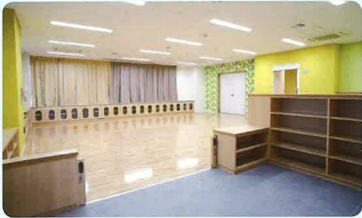
④ 子育てプレイルーム (1F)