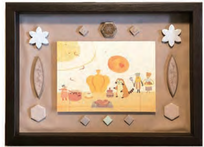
©NIPPON ANIMATION CO., LTD. "Anne of Green Gables"™ AGGL (日本アニメーション広報)

世界名作劇場シリーズは1975年放送の「フランダースの犬」、「母をたずねて三千里」「あらいぐまラスカル」「赤毛のアン」など、今でも時代や世代を超えてご覧頂いております。当時の制作スタッフは、高畑勲さん、宮崎駿さん、近藤喜文さんとそうそうたるアニメ制作者が名を連ねており、見応えのある作品ばかりです。一方スタジオには、イラストレーターも在籍しています。アニメの1シーンを絵画にしたり、DVDなどの商品のパッケージを描いたりしています。