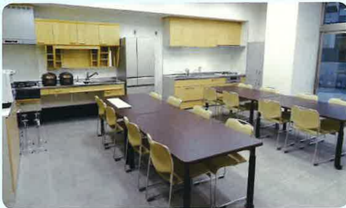
③ 調理室 (会議室) (1F)