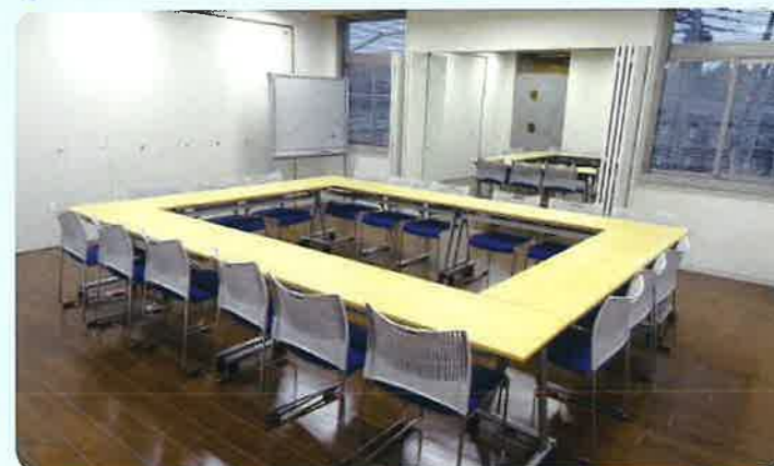
⑦ 会議室1 (2F)