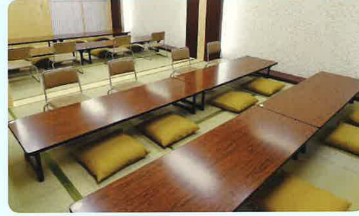
⑥ 和室 (2F) ※和室1と2は一体的に使うこともできます (写真)