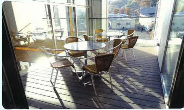
⑤ テラス (2F) ※雨天時は利用できません