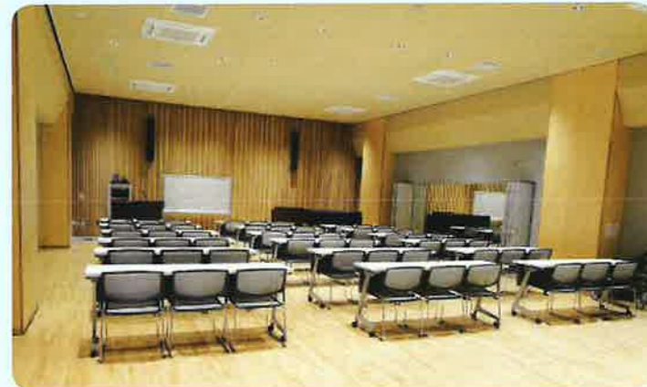
⑥ ホール (2F)