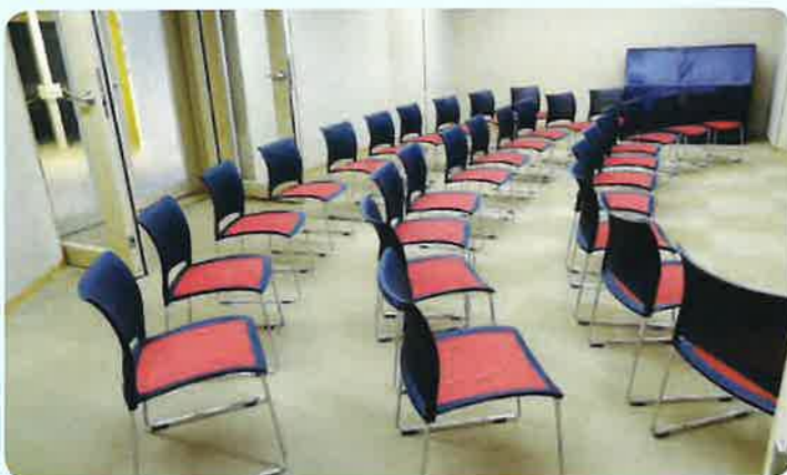
② 音楽室 (1F)