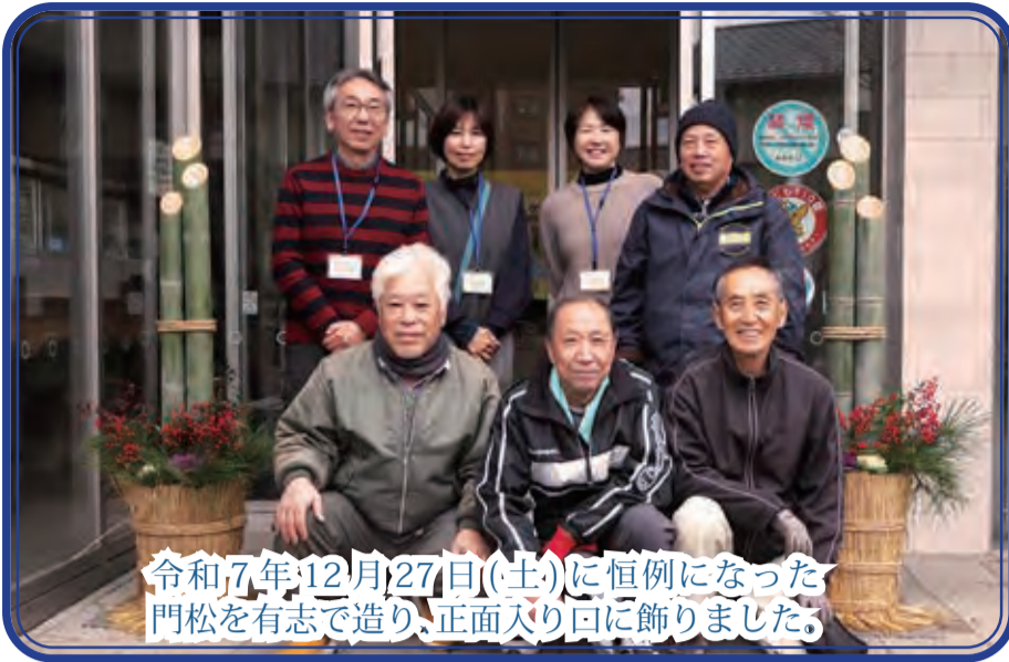
令和7年12月27日(土)に恒例になった門松を有志で造り、正面入り口に飾りました。