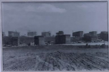
ニュータウンの造成(諏訪団地) mp004130-200020