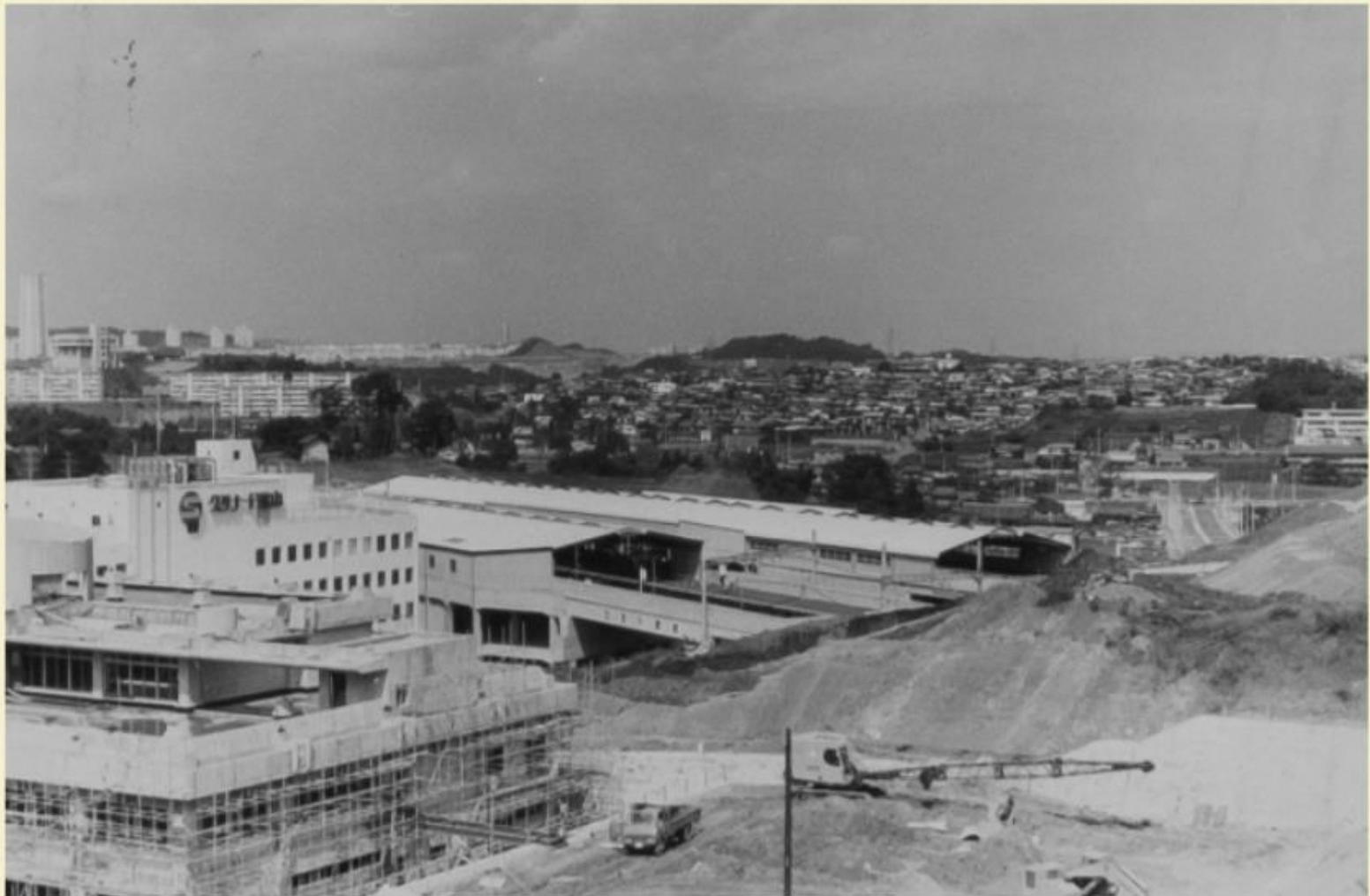
多摩の郷土写真 グリナード永山建築中 mp000470-200020