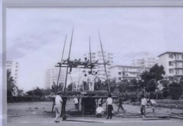
旧諏訪2丁目住宅管理組合