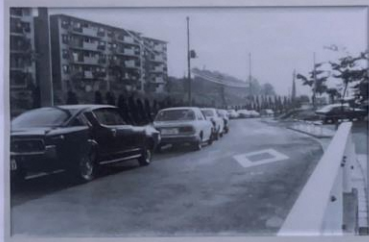
多摩ニュータウン 諏訪・永山団地 mp012250-200020