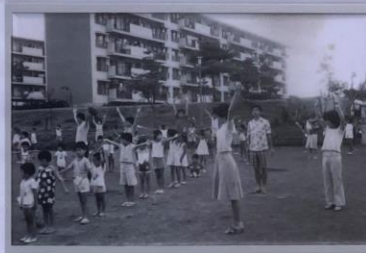
旧諏訪2丁目住宅管理組合