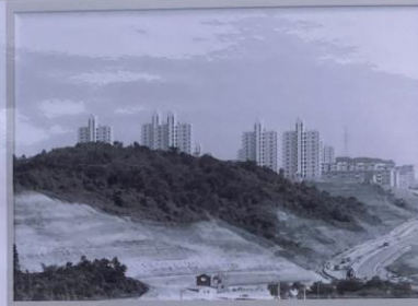
(団地風景) mp018230-200020