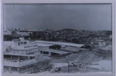
グリナード永山建築中 mp000470-200020