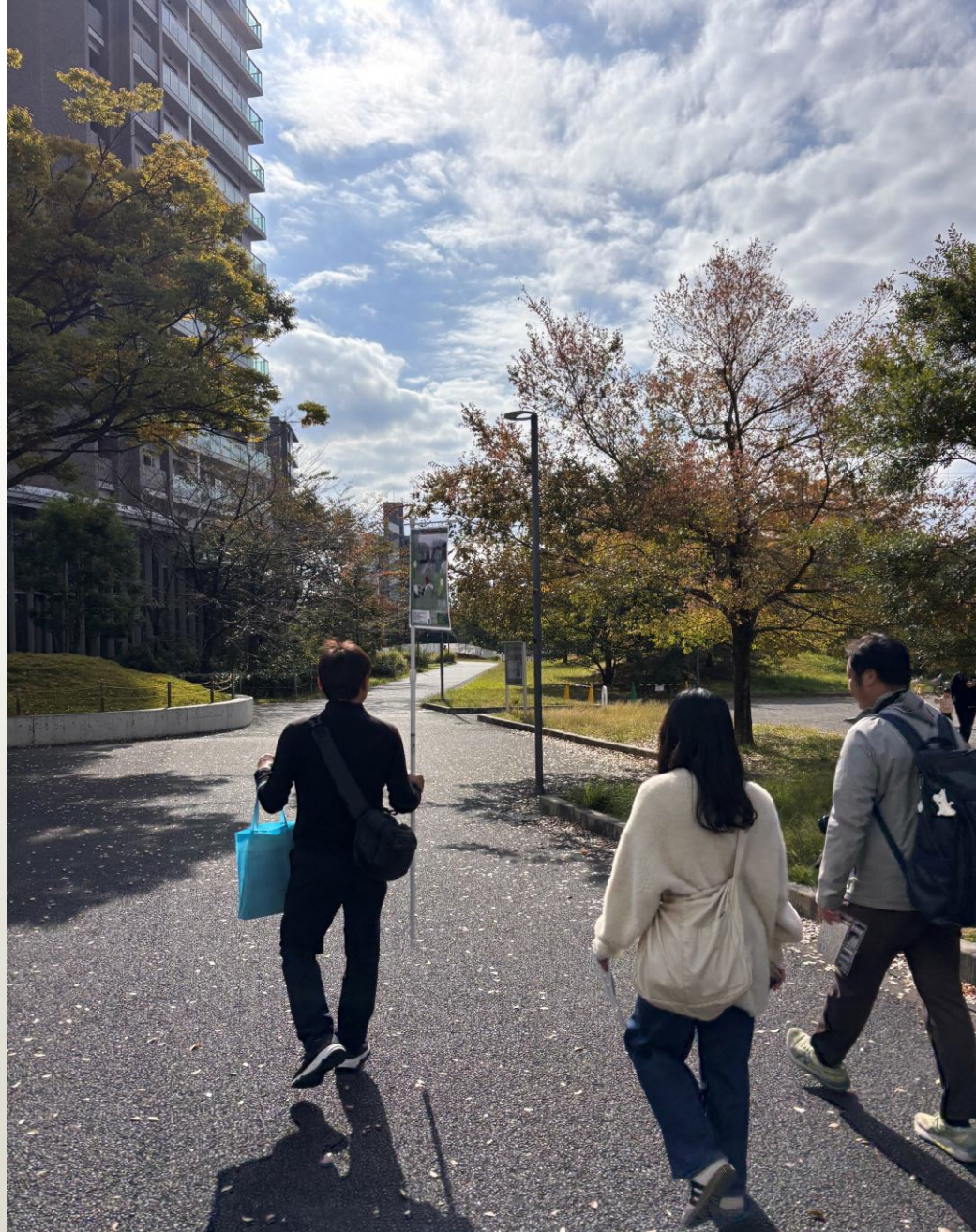
永山駅のグリナード広場に集合し、13名の参加者が一緒に歩きました。 天候にも恵まれ、気持ちよく歩くことができました。