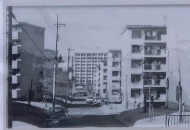
団地の風景 mp000900-200020