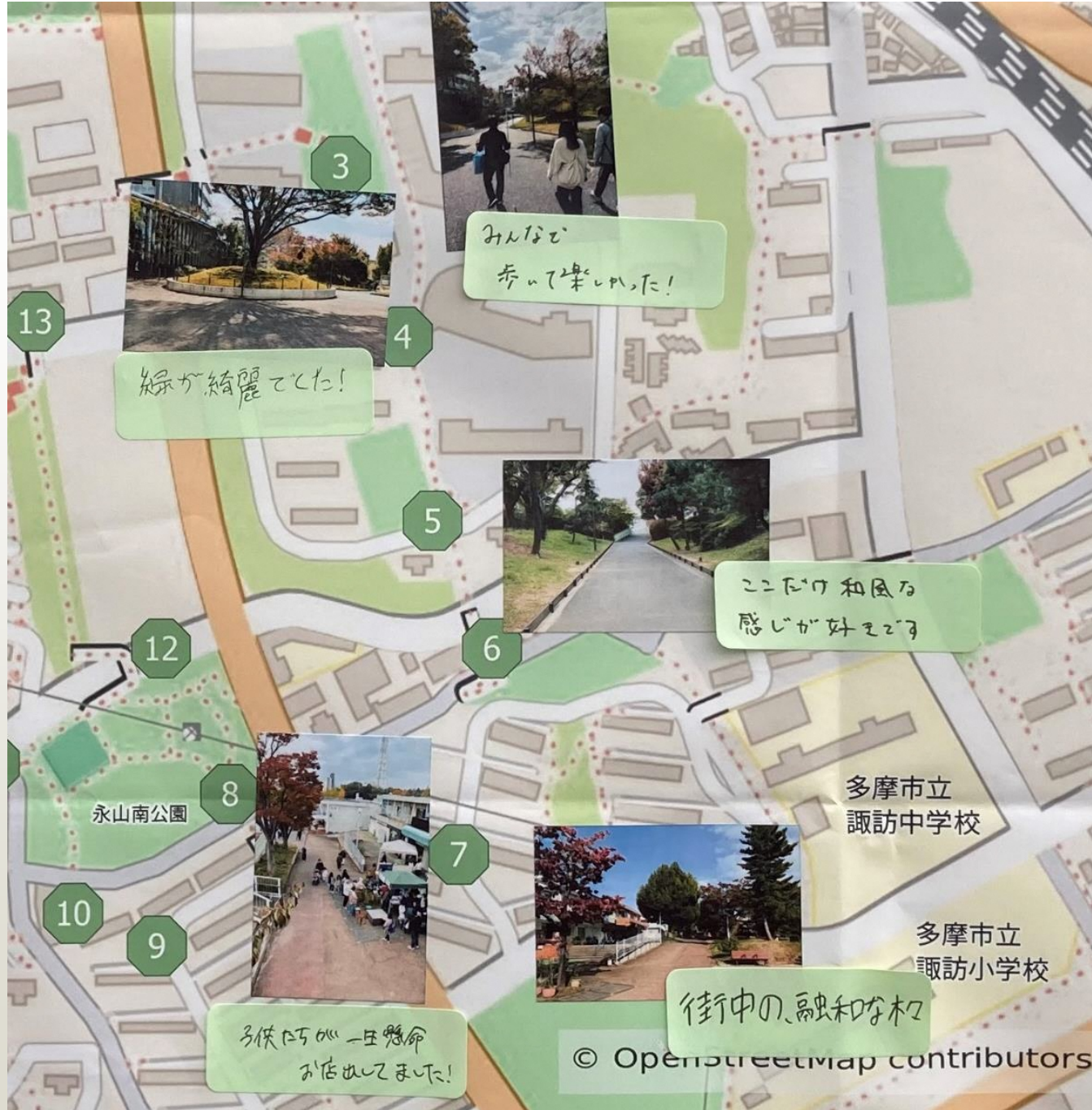
参加者のみなさまに撮影していただいた写真