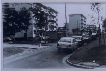
多摩ニュータウン 諏訪・永山団地 mp012280-200020