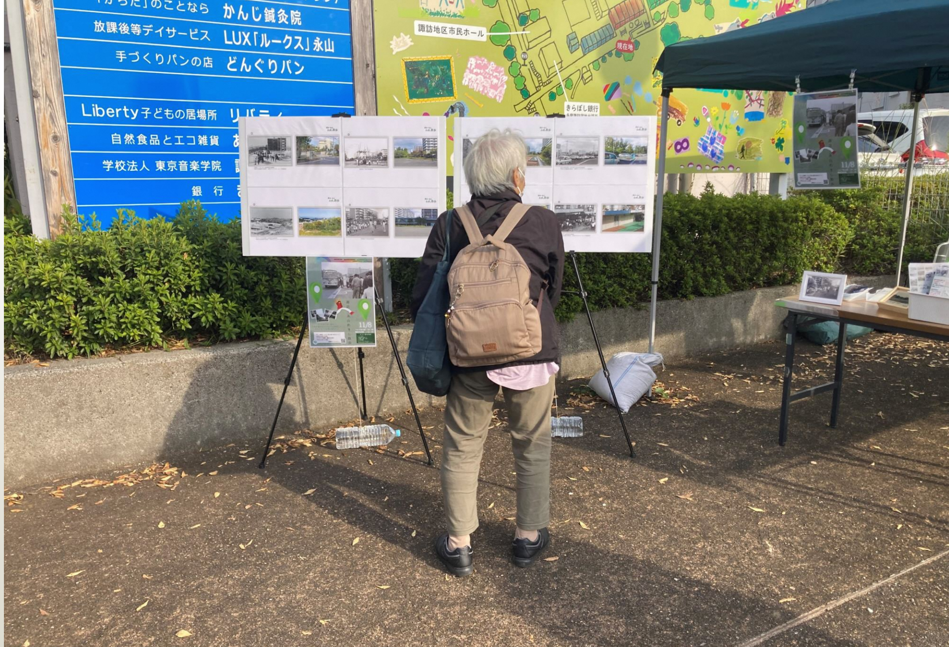
諏訪名店街のブースでは、昔の写真と現在の写真を並べたパネルを展示しました。足を止めてじっくりと見ていただく方が多数いらっしゃいました。