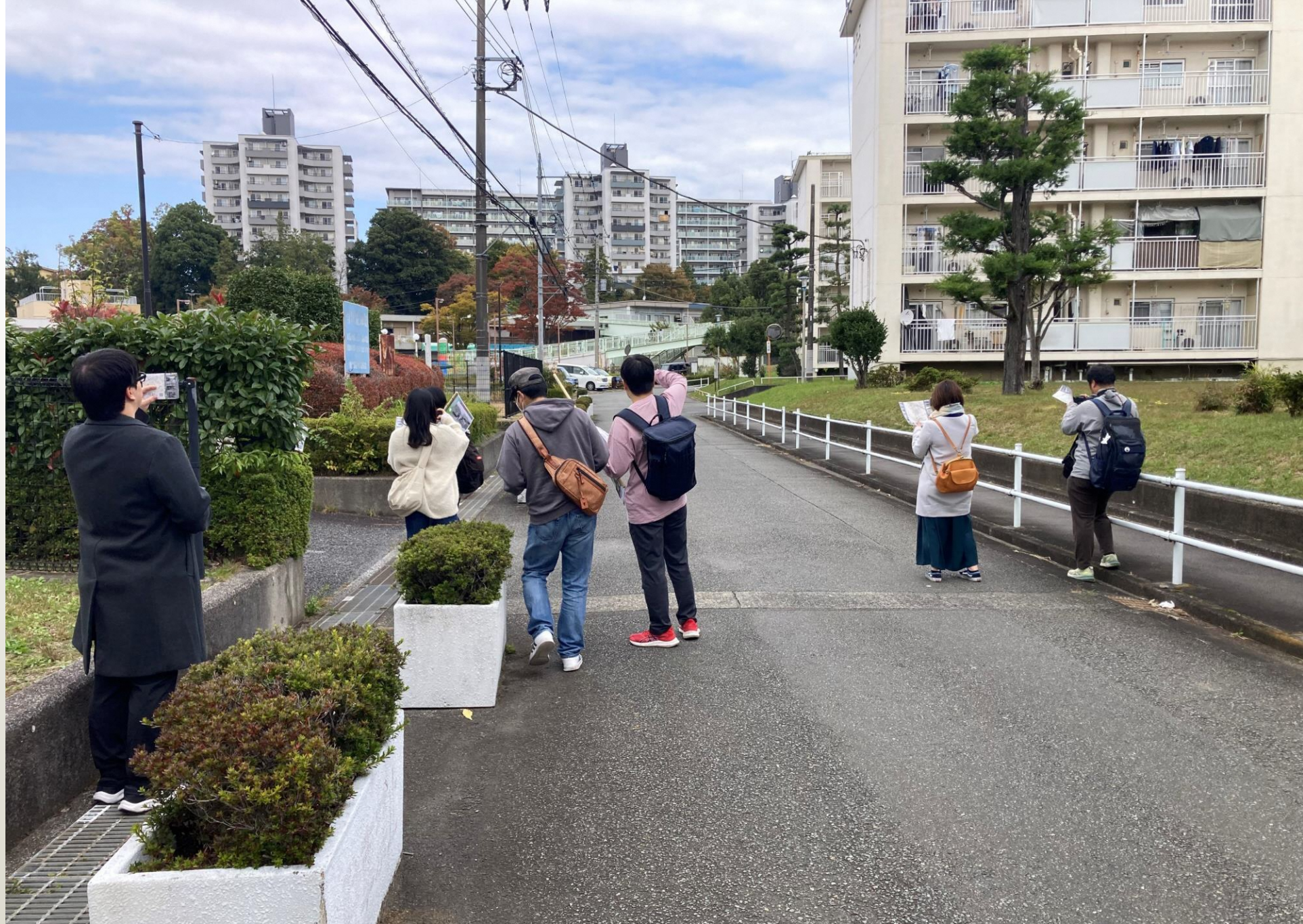
同じ構図の写真を撮るため、撮影する位置と角度について意見交換をしています。