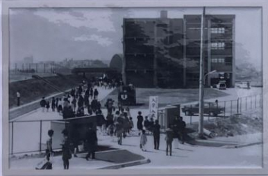
北藤訪小入学入校式 mp002800-200020