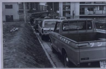
昭和46年3月入居都営住宅(諏訪)内内周道路 mp004690-200020