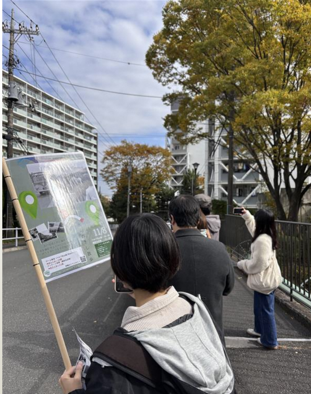
こだわる人はこだわるもので、何度も撮り直していました。