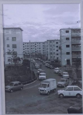
団地の風景(団地と自家用車) mp016710-200020