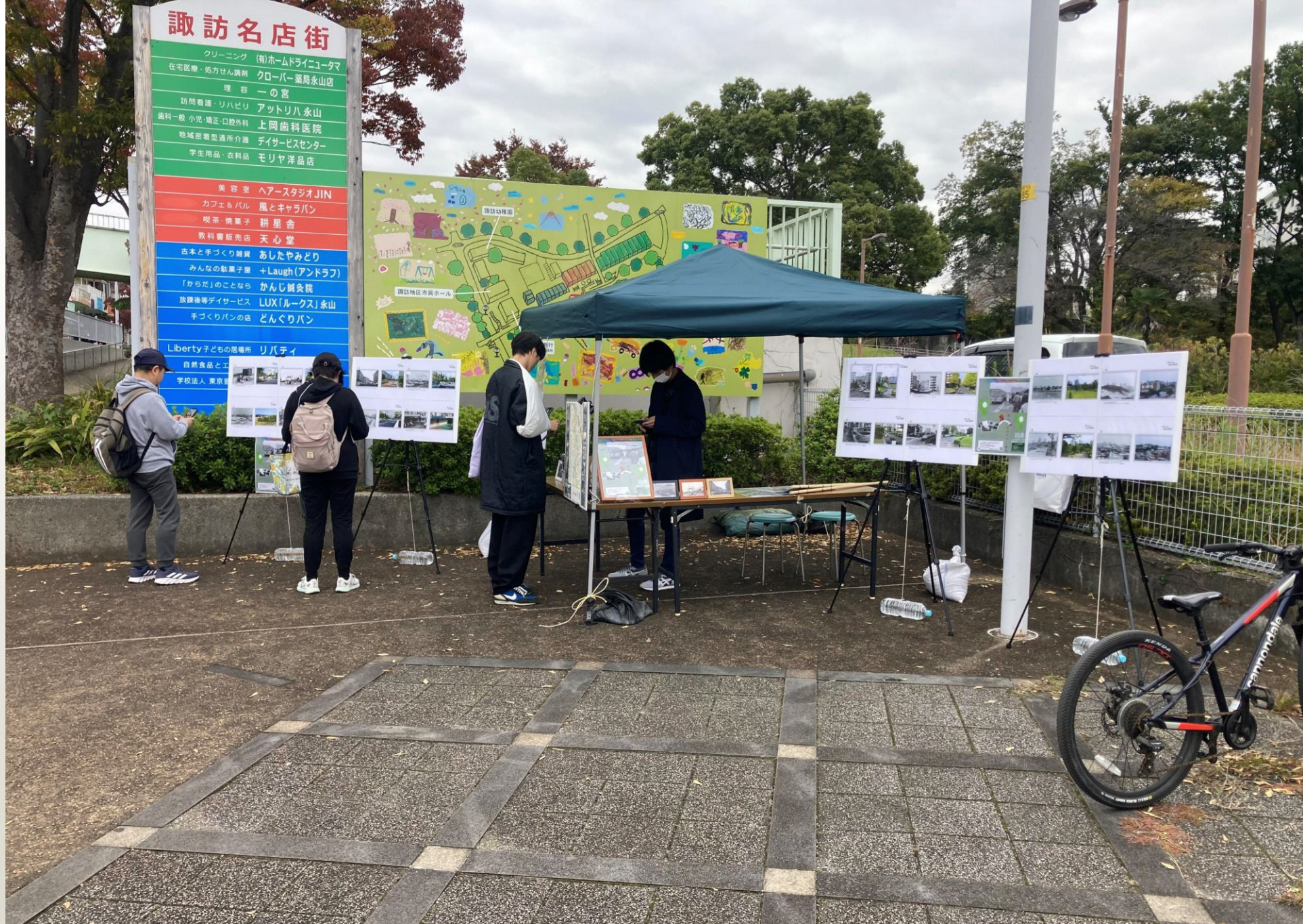
最後は誼訪名店街のブースに到着し、交流イベントは終了しました。