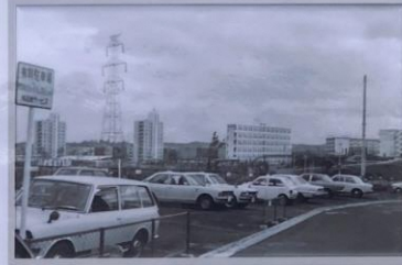
団地の風景(団地と自家用車) mp016700-200020