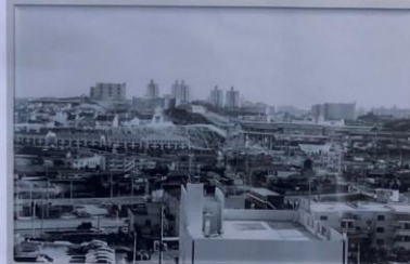
市役所から見た団地風景(永山駅方面) mp000090-200020