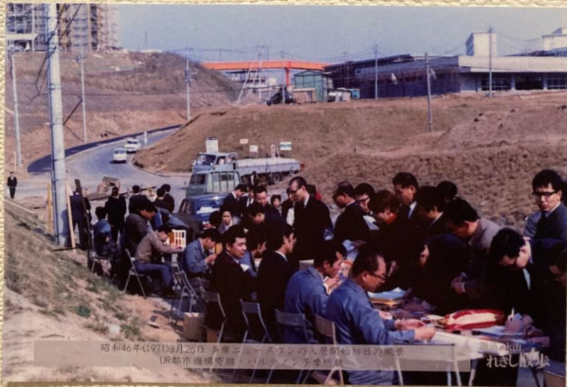
昭和46年(1971)3月26日 多摩ニュータウンの入居開始初日の風景