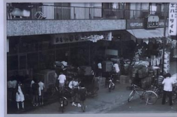
諏訪商店街 mp019510-200020