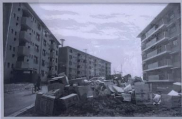
諏訪・永山の入居風景（昭和46（1971）3月28日）