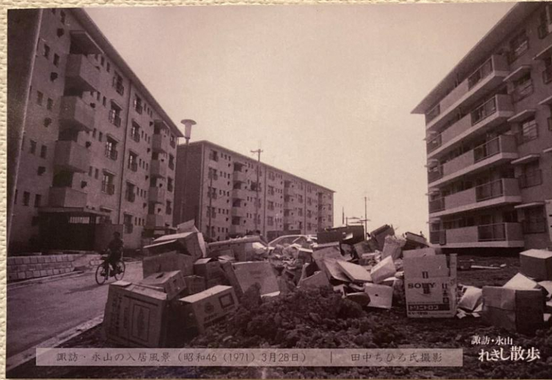
諏訪・水山の入居風景（昭和46（1971）3月28日）