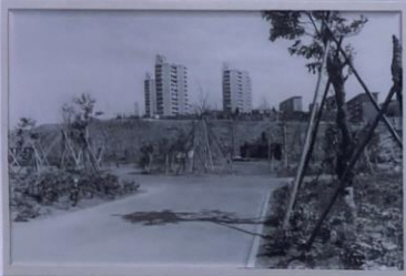
多摩ニュータウン 永山北公園から諏訪団地 mp012170-200020