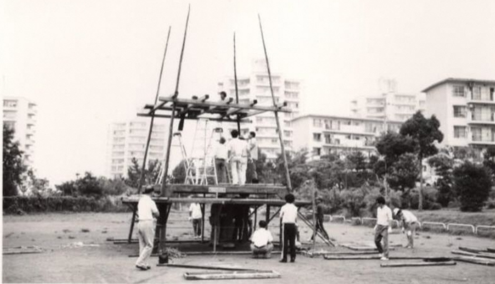
旧諏訪2丁目住宅管理組合

3番目の撮影スポットは、「諏訪2丁目住宅」の頃からお住いの方に昔の写真をお借りしました。 今でも毎年開催されている夏祭りのやぐらを組み立てているところです。