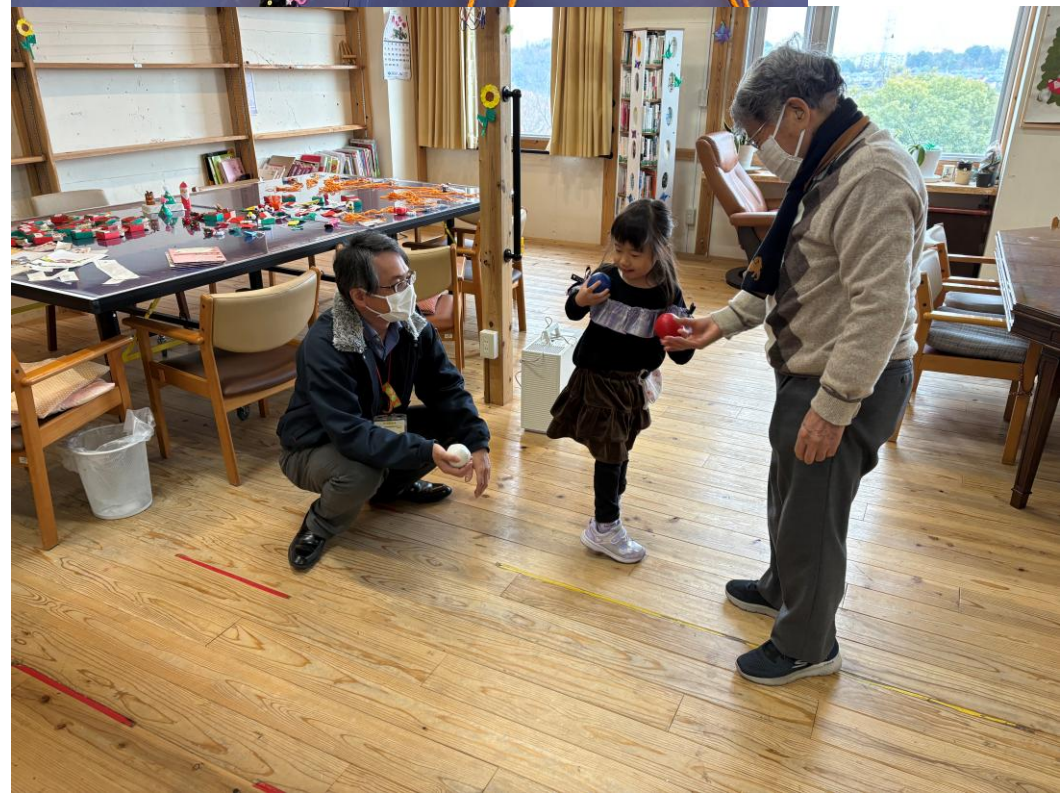
2025年12月20日（土）の光景 オレンジパートナー（多摩市民）がリード 子どもから高齢者まで参加