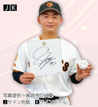
I サイン色紙 K サインボール