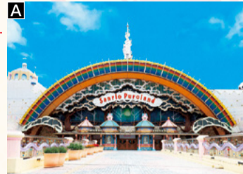
© 1990 SANRIO CO., LTD. APPROVAL No.P1712032