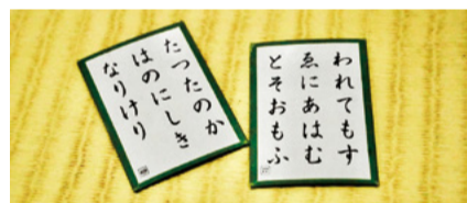
▲特別な取り札「69番あらしぶく(左)」「77番せをはやみ(右)」

試合を後から見返すと、1試合目は負けていて、「こんなに差がついていたんだ」と驚くくらい試合中は集中していることに気づきました。偶然にも最後に取った札は69番。「第69期クイーン」と同じ番号で、運命を感じました。