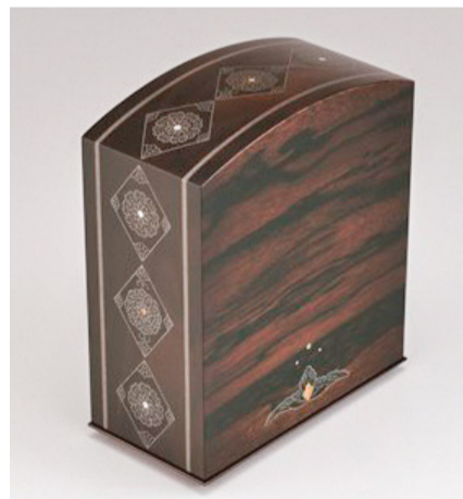
▲第65回日本伝統工芸展東京都知事賞受賞作品 黒柿蘇芳染嵌荘箱「西方の風」

「何百年という時を生きてきた木々が内に秘めた美しさを引き出し、それを作品として形にする」その想いを、ひとつひとつの作品に込めています。