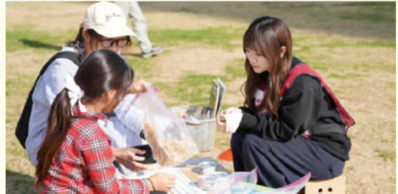
▲多摩大学と連携(学生がファシリテーター(進行役)としてキャンプの運営に協力)して事業を実施しています

缶詰や調味料を組み合わせ、簡単でおいしいおかずを作ります。災害時でも栄養バランスを考えた料理を作る方法を学びます。