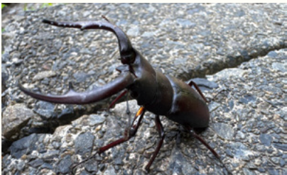
▲ノコギリクワガタ