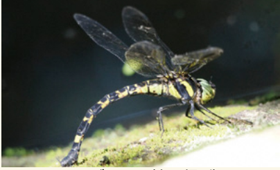
▲ヤブヤンマ