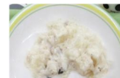
↑ブロックフィスクル

直訳すると「砕けた魚」という意味のブロックフィスクル。白身魚(主にたら)とじゃが芋に、バターと牛乳を混ぜて作ったシチューとグラタンの間のような料理で、余り物を食べ切るために考案されたのが始まりだそうです。今ではアイスランドの定番料理で、家庭によってさまざまなレシピがあります。