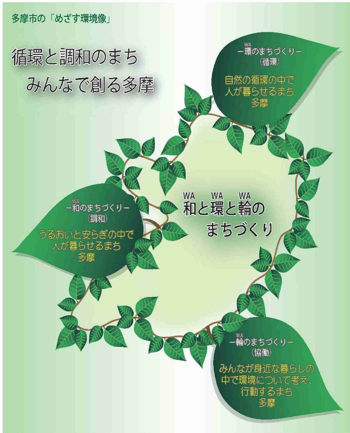
図 めざす環境像のイメージ

「計画の基本理念」をイメージ化したのが、多摩市がめざす環境像『循環と調和のまち みんなで創る多摩 一和(WA)と環(WA)と輪(WA)のまちづくりー』です。