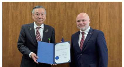
アイスランド外務省名誉勲章受章