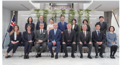
グズニ大統領来訪