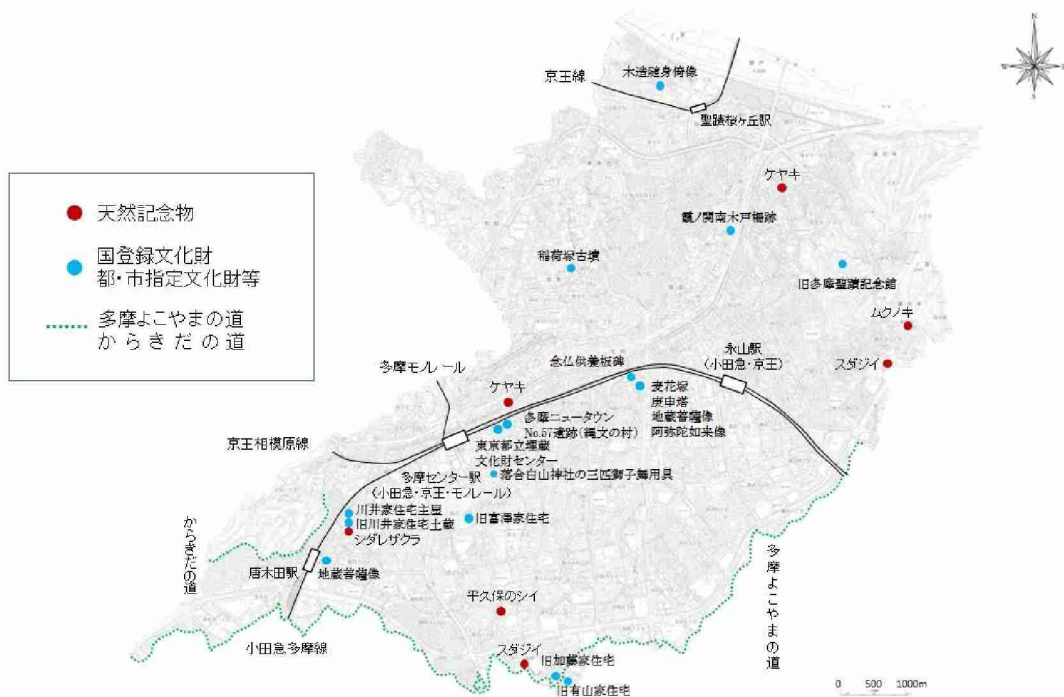
この地図は、東京都知事の承認を受けて、東京都縮尺 2,500 分の 1 地形図を利用して作成したものである。 (承認番号) 4 都市基交著第 63 号