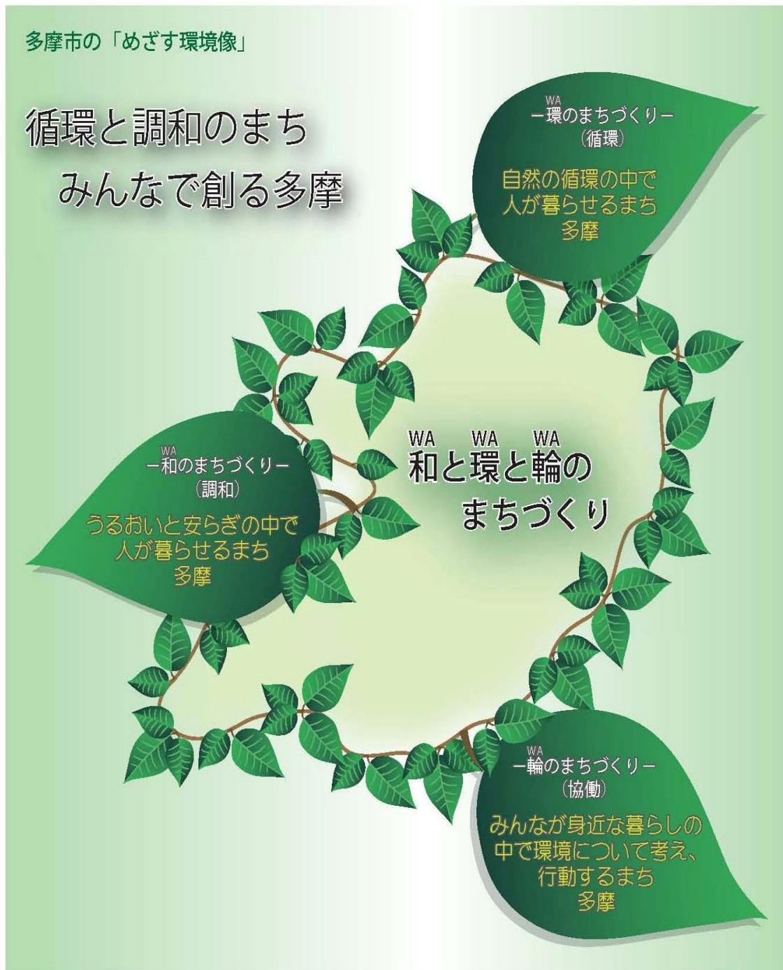
図 めざす環境像のイメージ

「計画の基本理念」をイメージ化したのが、多摩市がめざす環境像『循環と調和のまち みんなで創る多摩 一和(WA)と環(WA)と輪(WA)のまちづくりー』です。