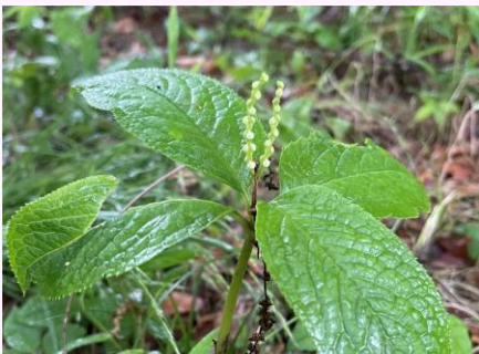
D.フタリシズカ (センリョウ科)