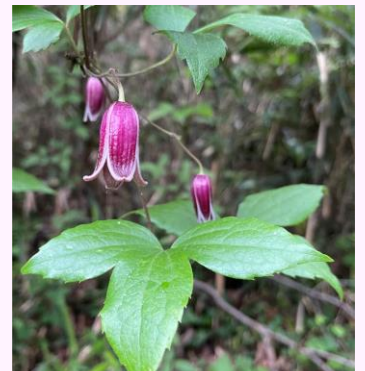
F.ハンショウヅル (キンポウゲ科)