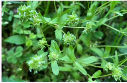
B.ノヂシャ (スイカズラ科)