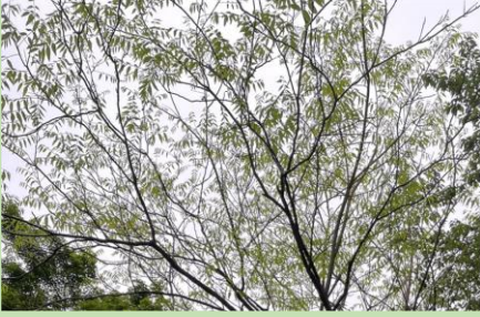
A.ムクロジ (ムクロジ科)