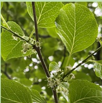
G.アオハダ (モチノキ科)