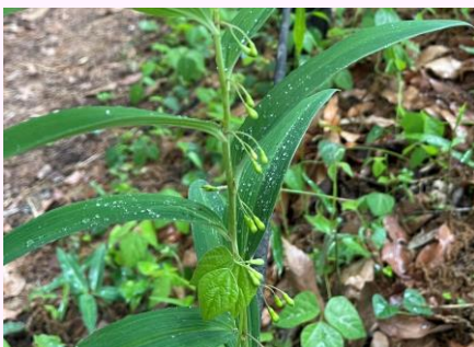
J.ナルコユリ (キジカクシ科)