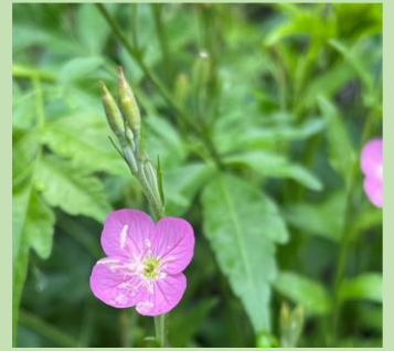
C.ユウゲショウ (アカバナ科)