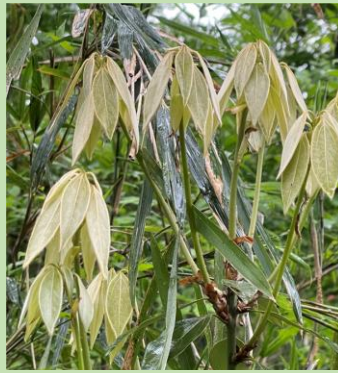
E.シロダモ (クスノキ科)