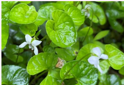
H.ニョイスミレ (スミレ科)