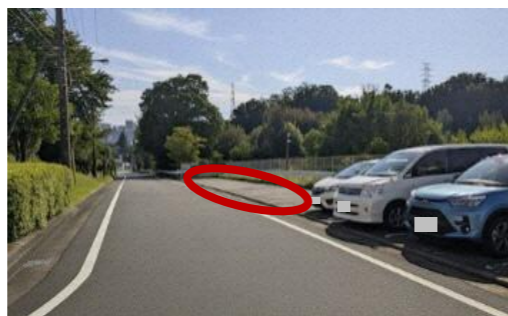
図 住宅地内におけるタクシー待機場所整備の例

<取組例> 住宅地内におけるタクシー待機場所の整備 / タクシーチケット配布の検討