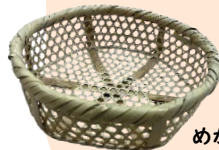
めかい (シノ竹で作ったカゴ)

すみや つく 多摩には「炭焼き」や「めかい作り」 などの仕事があったよ。むかしの仕 事の道具を見てみよう！