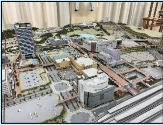
「多摩センター周辺ジオラマ(2000年頃)」