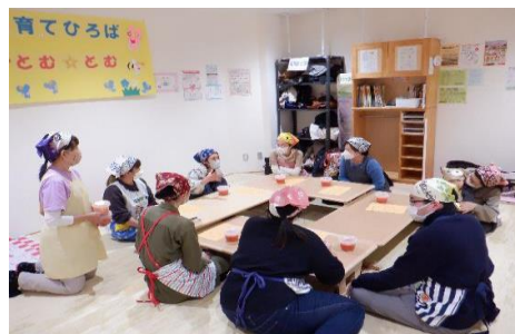
トマト麺づくり (落合児童館)