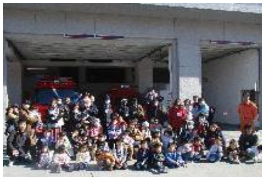
たましょうぼうしょにいこう！