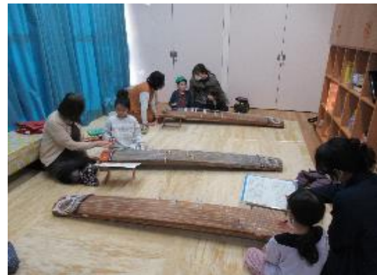
おこをひいてみよう！