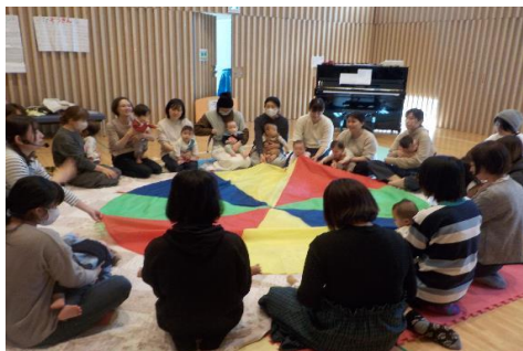
「リトミック」 (唐木田児童館)

乳幼児の保護者が子育ての不安を解消したり、リフレッシュしたりする機会として月1回以上「子育て講座」を実施しています。以下は講座の様子の一例です。その他の取り組みは、「2. 各館の事業内容」を参照してください。