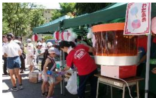
「ナツアソビ」大人気のわたあめ