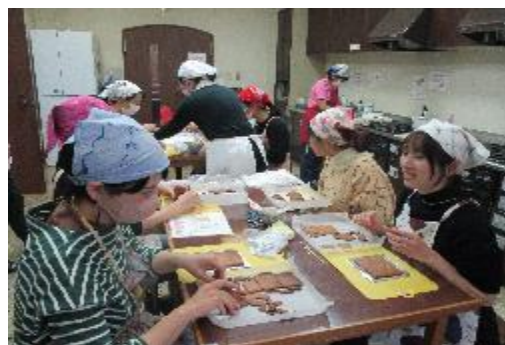
ヘクセンハウス作りと 絵本を楽しもう！！