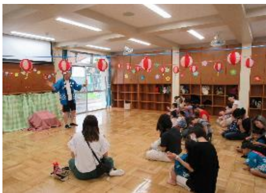
幼児のつどい「かくれんぼ」