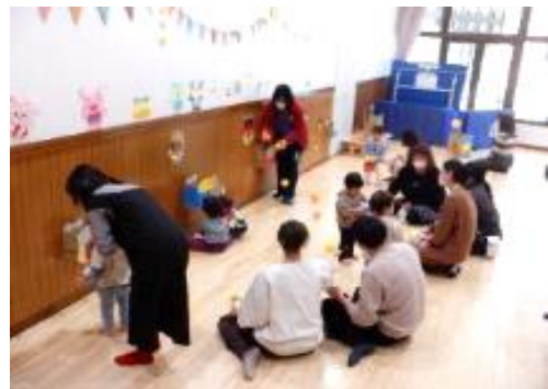
キッズ☆パラダイス 「節分遊び」