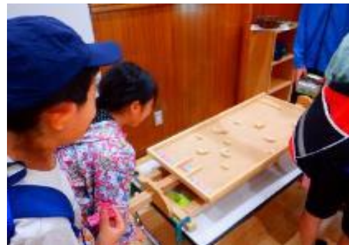
わいわいマーケット