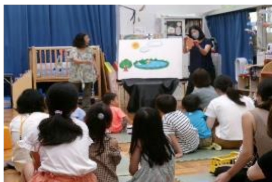
「パネルシアターピーちゃんの公演」