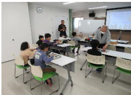
子ども科学実験教室