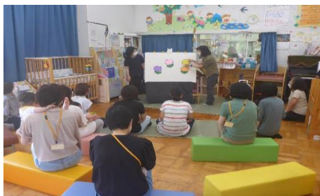
ピーちゃんのパネルシアター (諏訪児童館)