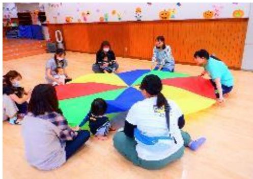
ふれあいリトミック