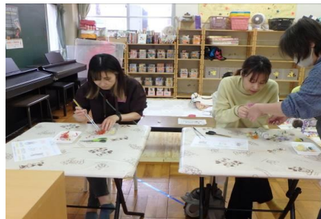
「ハーバリウムワークショップ」 (永山児童館)