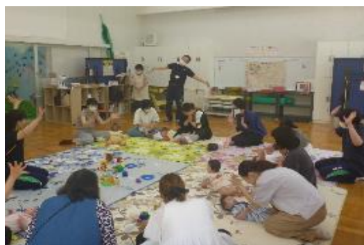
幼児のつどい「ひなたぼっこ」