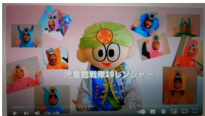
【児童館戦隊10レンジャー】

令和5年度は多摩市の児童館開設から50年を迎える年に当たり、いくつかの記念事業を実施しました。その一つ、11月23日に実施したイベント「まるっとじどうかん」の告知として、PR動画を作成しました。各児童館のイメージカラーをモチーフに“児童館戦隊10レンジャー”が出演し、イベントの告知を行いました。