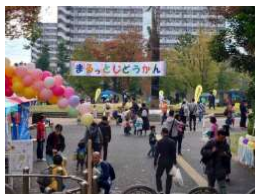
児童館50周年記念イベント【まるっとじどうかん】