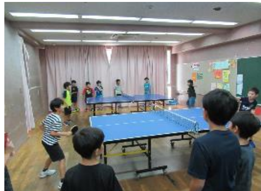
一ノ宮児童館との「交歓卓球大会」