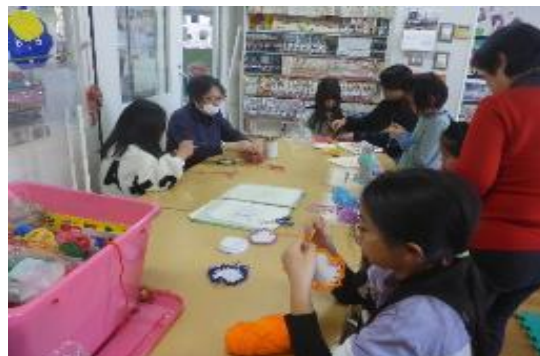
「あみあみあみっこ」